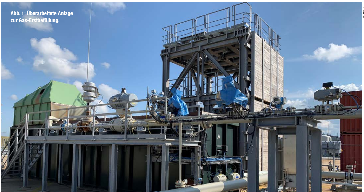
Abb. 1: Überarbeitete Anlage zur Gas-Erstbefüllung.